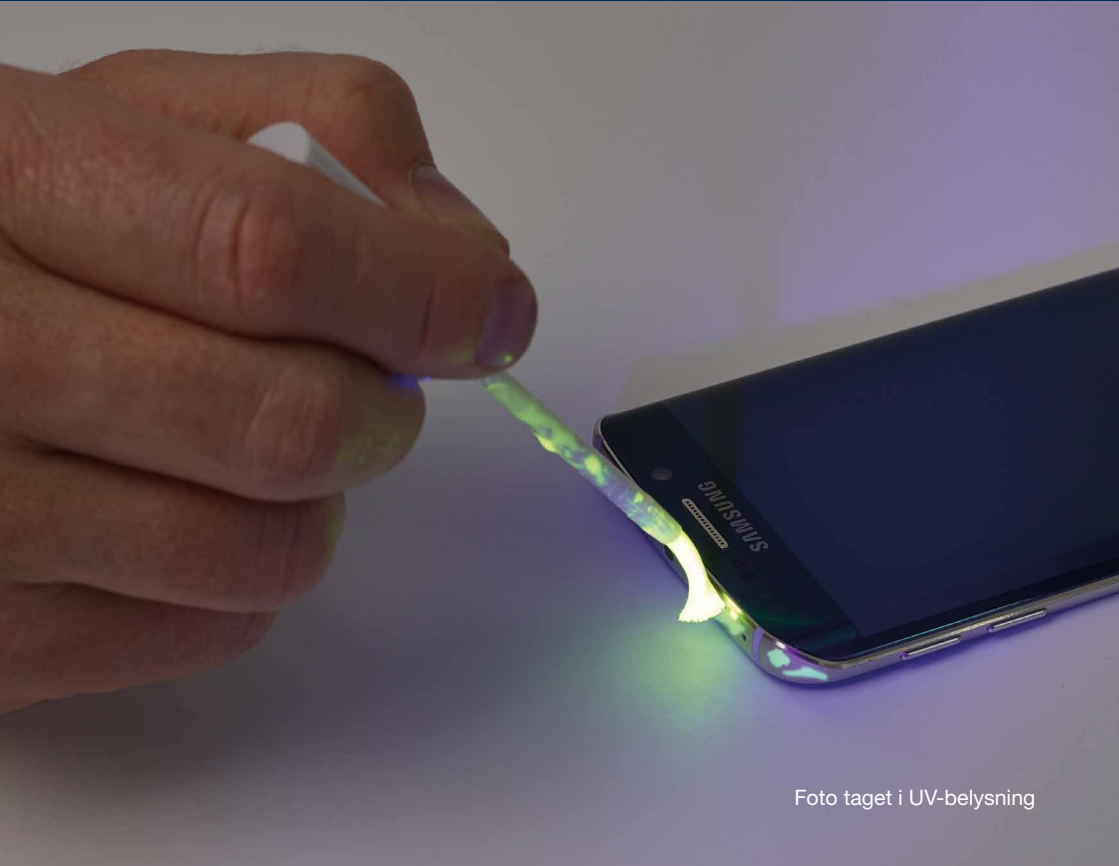
Foto taget i UV-belysning

VIKTIGT - Läs instruktionerna innan du använder SmartWater®